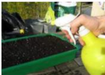
Brumisation des graines