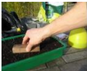
Tassement de la terre dans la caissette

- Tassez délicatement la surface, avec le plat de la main ou mieux, à l'aide d'une petite planche en bois. Les graines seront ainsi mises au contact de la terre.