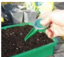
Semis au semoir à graines

-graines d'haricot : grande taille : 2 à 3 cm de terreau par-dessus